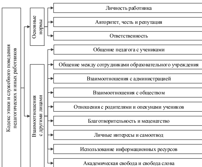
Рис. 5. Кодекс этики и служебного поведения педагогических и иных работников

На наш взгляд, важно учесть и этические нормы (рис. 5).