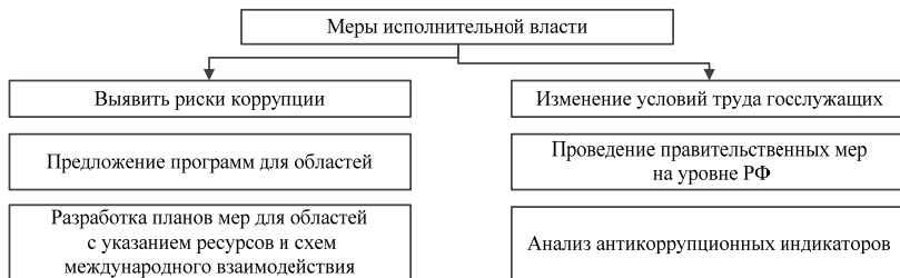
Рис. 4. Примерная схема блока элементов «Меры исполнительной власти» антикоррупционной стратегии

Специфика данной сферы обуславливает необходимость разработки и реализации дополнительных механизмов противодействия коррупции, учитывающих отраслевые особенности.