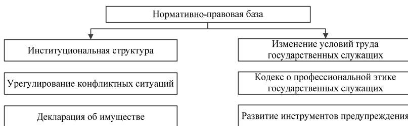
Рис. 2. Примерная схема блока элементов «Нормативно-правовая база» антикоррупционной стратегии

Примерные блоки элементов антикоррупционных стратегий противодействия развитию коррупции представлены ниже (рис. 2–4).