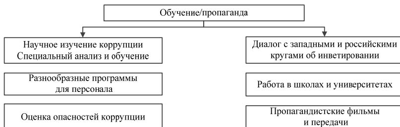
Рис. 3. Примерная схема блока элементов «Обучение/пропаганда» антикоррупционной стратегии